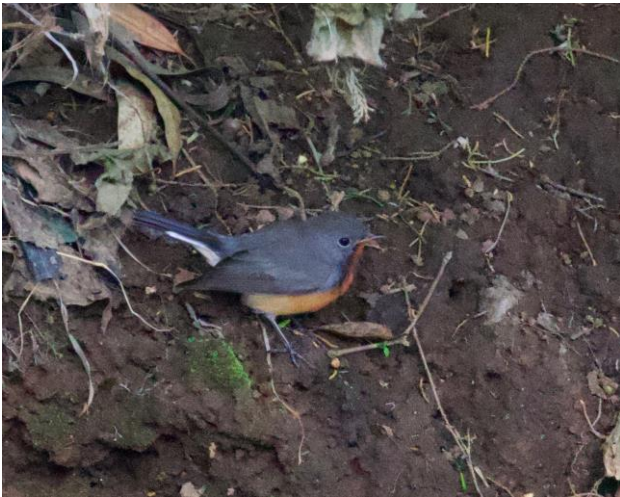
Kashmir Flycatcher To smukke højlandsspecialiteter med tilbagetrukken levevis