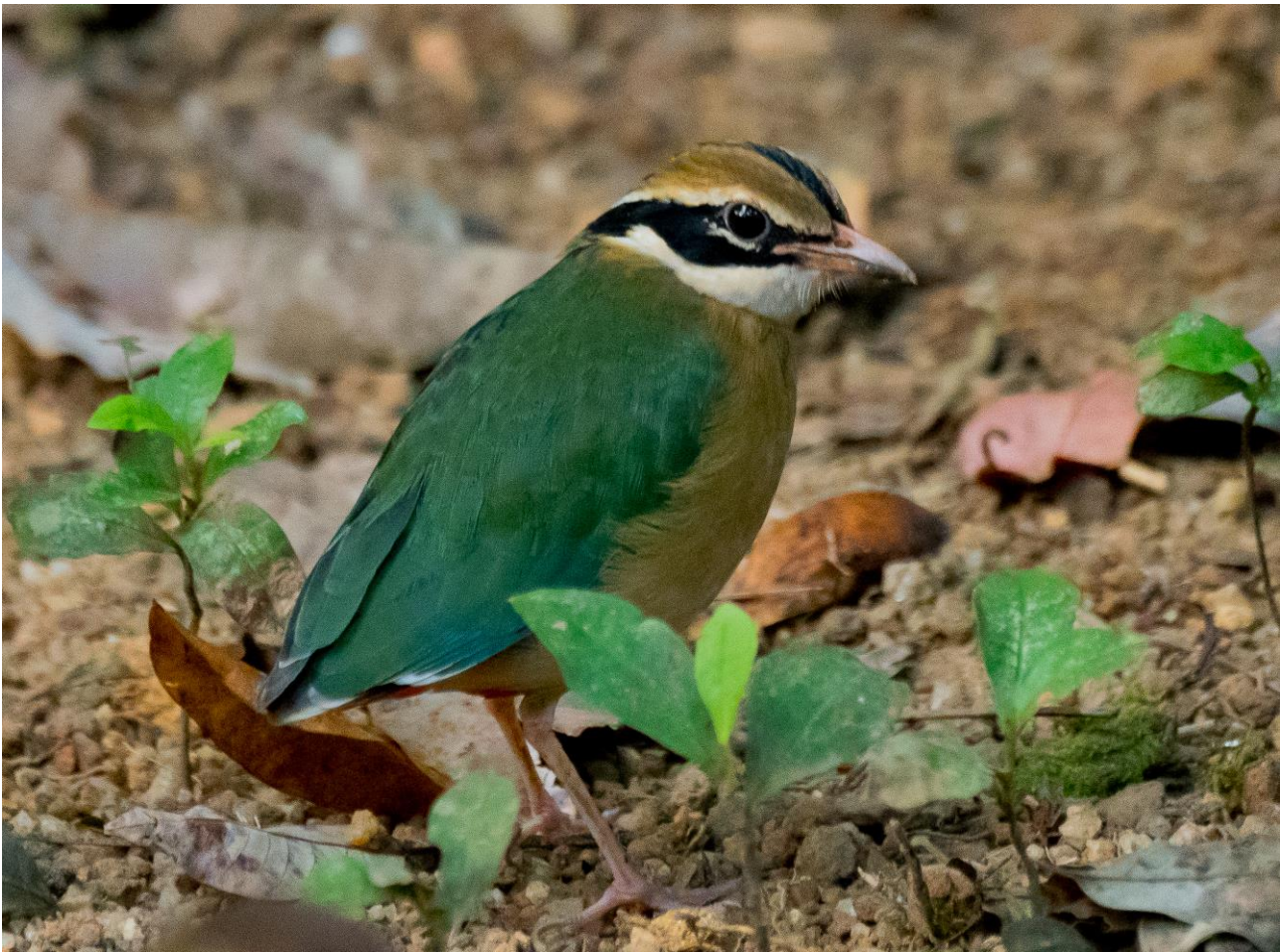
Indian Pitta vintergæst på Sri Lanka og en nærmest ikonisk fugl for hele subkontinentet