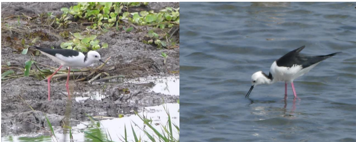
White-headed Stilt 19.1 og 21.1, en art til diskussion

1 i vådområde ved Tissamahamara dag 6 og 1 i Bundala dag 8, viste begge klart karakterer som denne nu splittede form fra Indonesien/Australien. Begge fugle i rapporten her med foto - kendetegnet ved skarptegnet sort på baghals til hvid øvre ryg og hvidt hoved. Fugle som disse er før beskrevet fra SL, bl.a. også et foto på netfugl.dk (Morten B.-Hansen i Bundala januar 2013). Det er ikke helt afklaret, om der eventuelt kunne eksistere en særlig lokal variant med de samme karakterer, eller om den, som det mest sandsynlige, er en fåtallig, overset vintergæst.