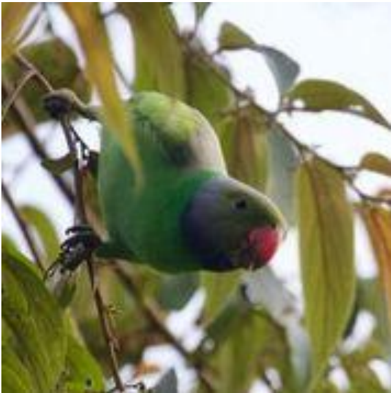
Layard's Parakeet Sri Lankas to endemiske papegøjearter

Flere i skovene ved Kitulgala og Sinharja, fx op til 30 dag 10.