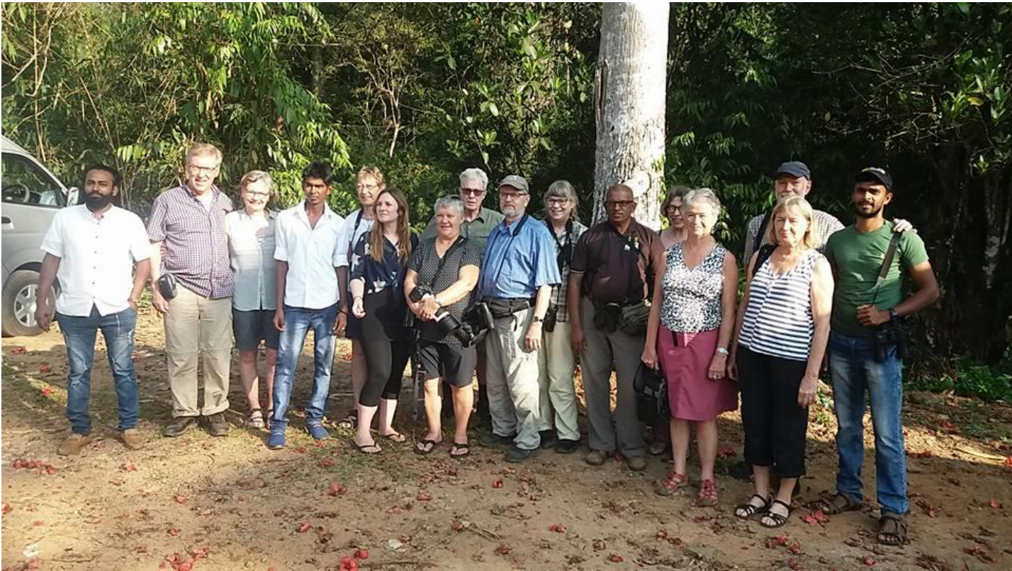
Foto: Den samlede gruppe med den faste stab