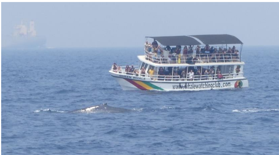
Blåhval, dyrets længde fornemmes, og finnen sidder langt tilbage på ryggen