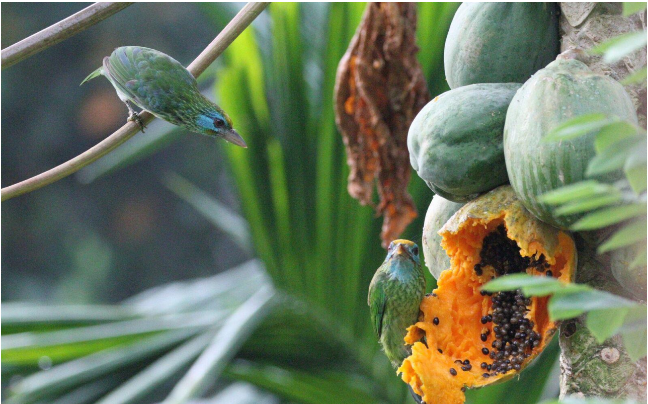
Endemisk og markant karakterart, Yellow-fronted Barbet